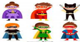
Illustration by M. P. P. P. P. P.

Bienvenue dans le monde de Disney et des super héros à Blaslay Land. Du Roi Lion à Cars en passant par les Monstres et Compagnie, tout le monde sera réuni. Qui de Thor, de Capitaine Américain et bien d'autres encore sera le plus fort ? Viens t'amuser entre amis.